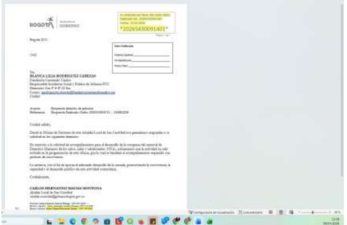
Fotografía No. 2 Evidencia de proyección de respuesta